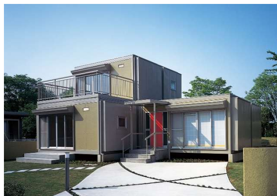
1977年に建築されたセキスイハイム (2004年につくば市に移築し復元)